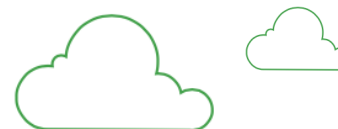
Tabla de tarifas 2020 Viva Smart